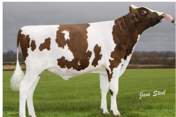
Augustus P red